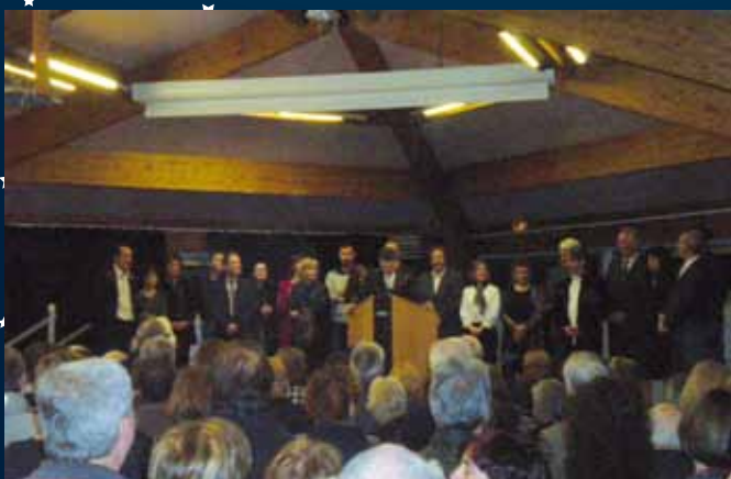
Les vœux du Maire pour cette nouvelle année