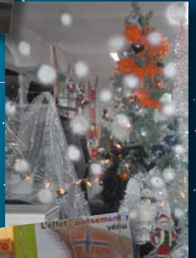
Vitrine du Salon de coiffure