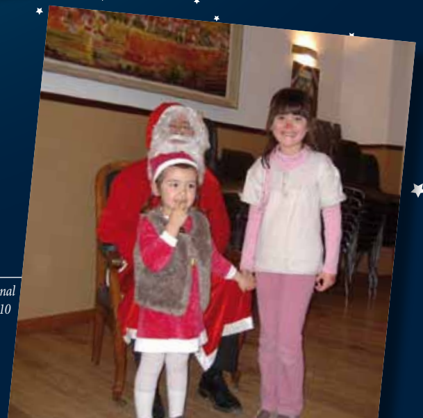
Noël communal 2010