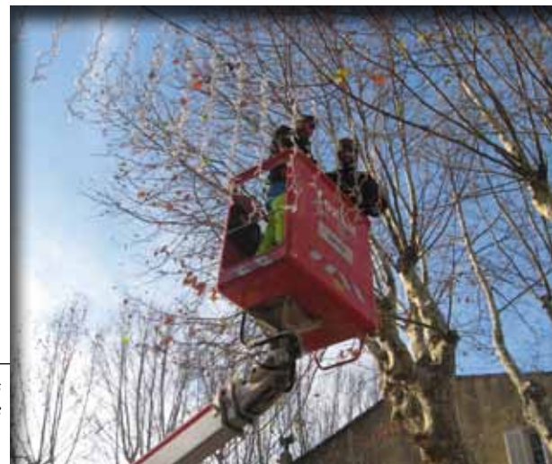
Pose des illuminations par le service technique

Adjoint au maire, délégué aux travaux et services techniques