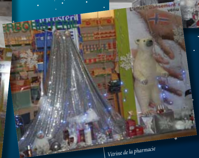
Vitrine de la pharmacie