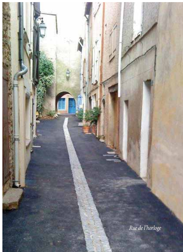
Rue de l'horloge