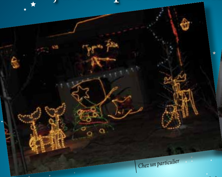
Chez un particulier