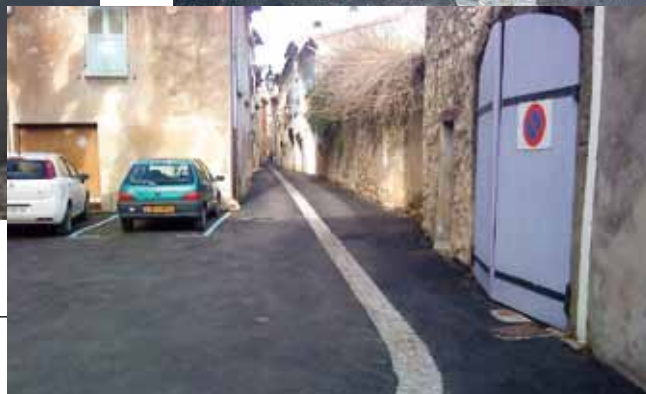
Rue des cloches