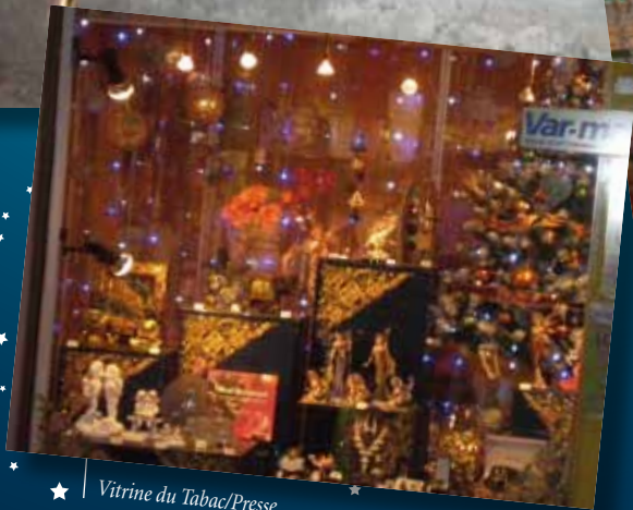
Vitrine du Tabac/Presse