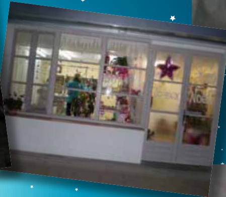
Vitrine des Griffes O Poils