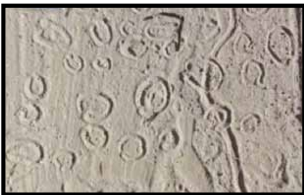
“C’était bien la journée qu’on avait passée” (Oxanna). “La journée était trop bien” (Elie)