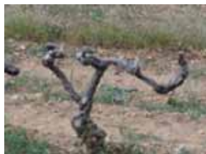
Un cep de vigne

“Céline avait oublié son sécateur !”(Youna)