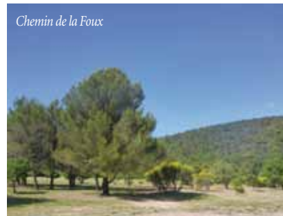
Chemin de la Foux