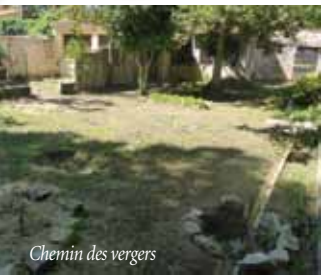
Chemin des vergers

Préparation du jardin destiné à accueillir un potager ludique pour les enfants du service "enfance & loisirs" et des écoles et réhabilitation du petit local qui pourra utilement leur servir de "cabanon".