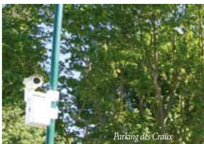
Parking des Craux

Création d'un accès direct aux toilettes pour les enfants de la cantine