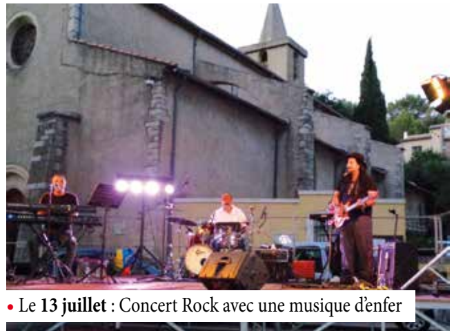
• Le 13 juillet : Concert Rock avec une musique d'enfer