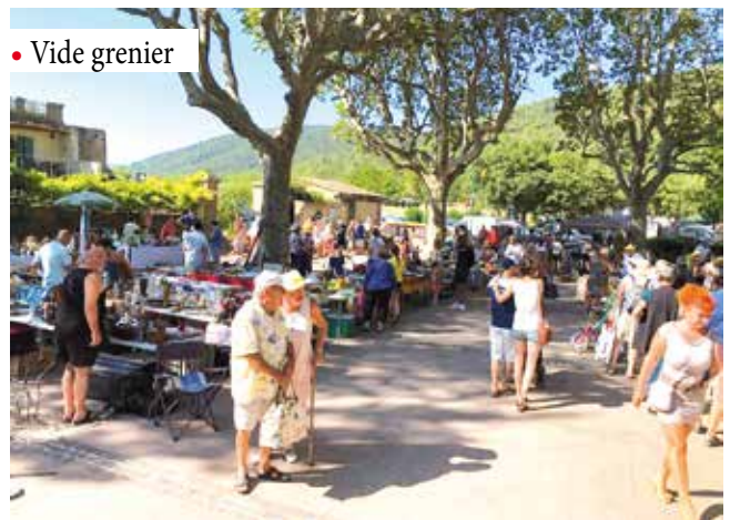
• Vide grenier