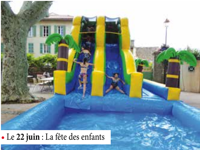
• Le 22 juin : La fête des enfants

Festivités organisées cet été par le Comité des Fêtes