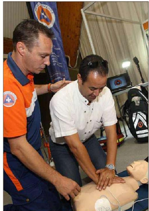
De nombreuses formations aux gestes de premiers secours sont régulièrement organisées sur le territoire.

Les numéros d'urgence : Le 18 : les sapeurs-pompiers pour